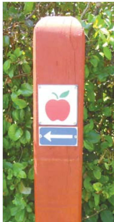
Ruten er mærket med stipæle med et rødt æble